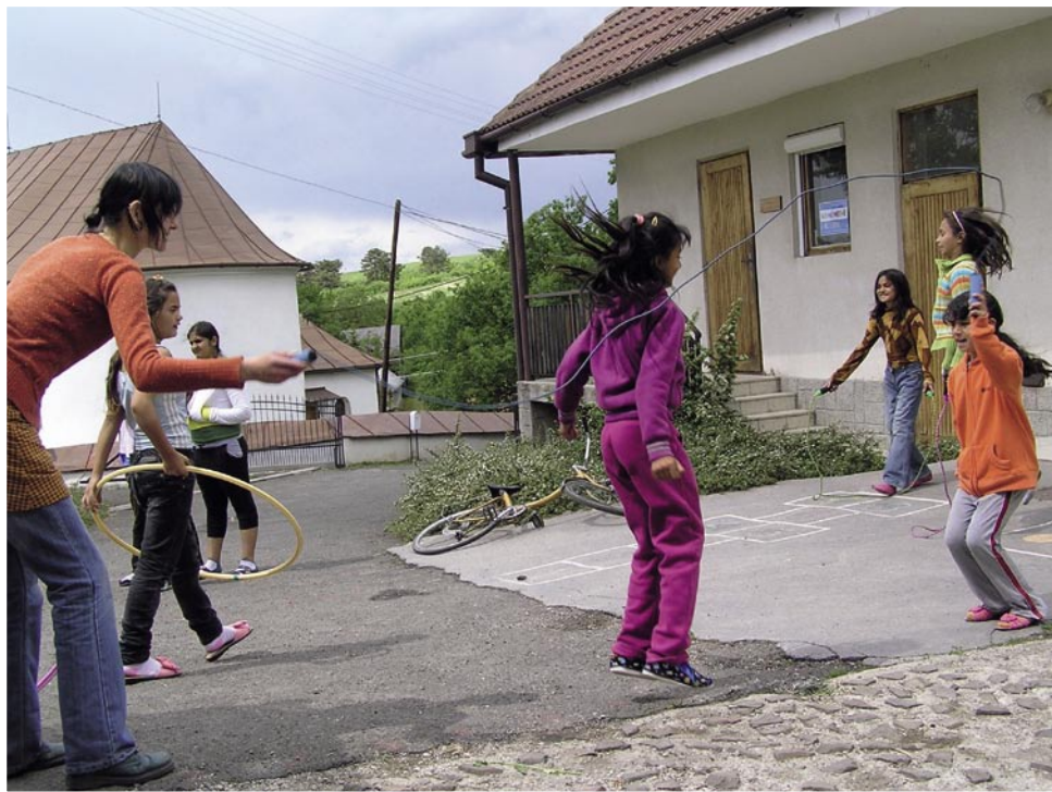
Fotky ze stáže ve vyloučených romských lokalitách na Slovensku